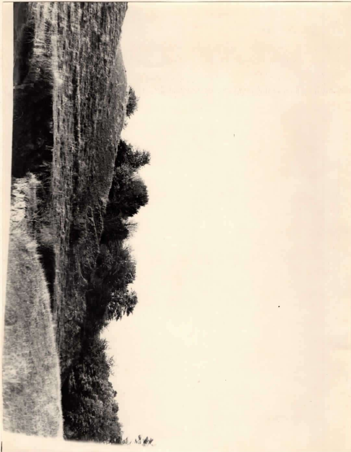
Слов"янське городище. Городище уличів X-XIстст. Загальний вигляд. Вінницька обл., Іллінецький р-н., с.Дашів.