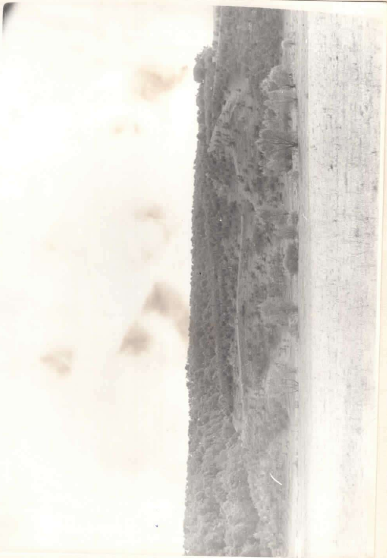
Слов"янське городище. X-XIстст. н.е. Загальний вигляд.

Вінницька обл., Гульчинський р-н., с.Суворівське.