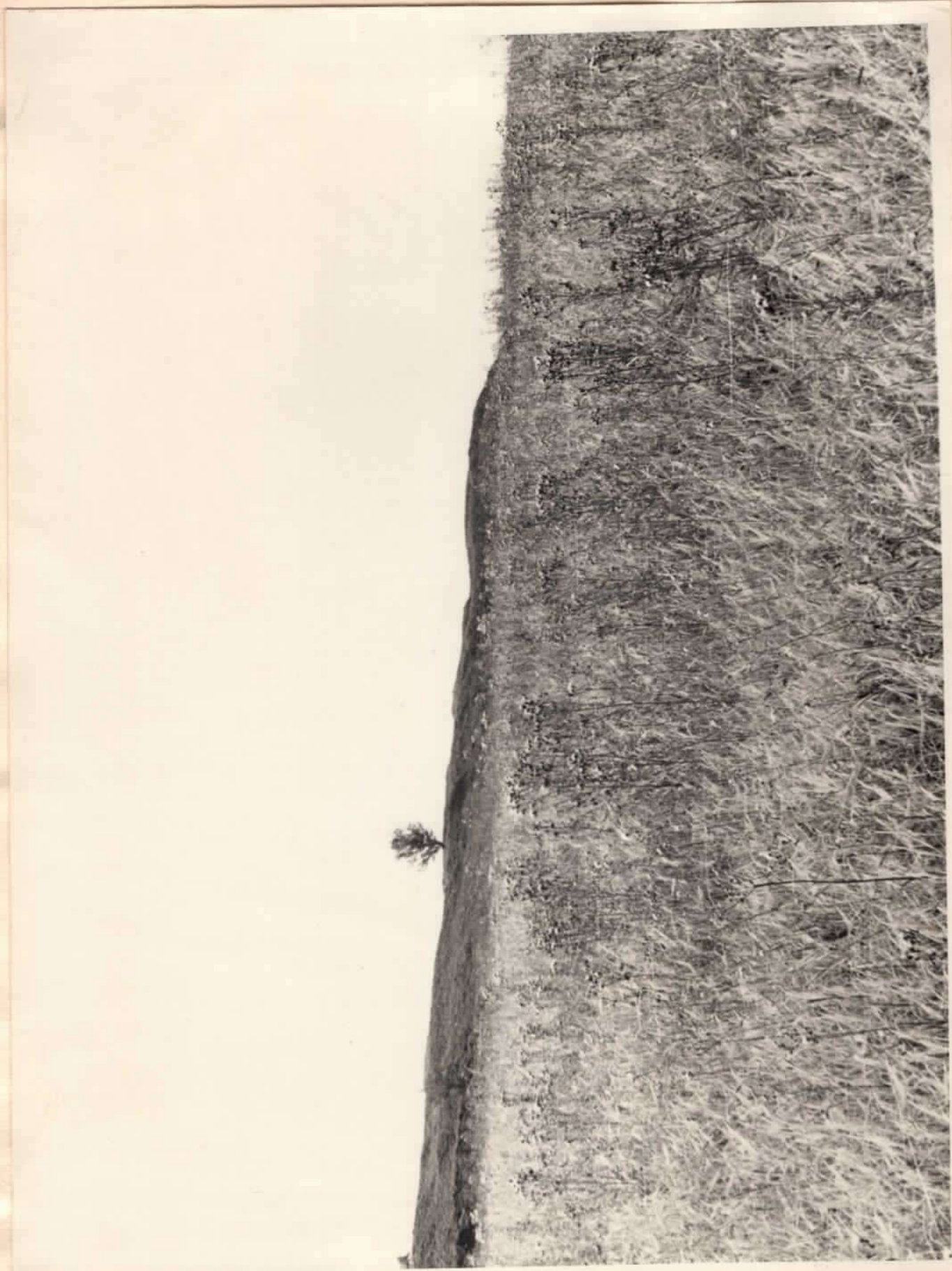
Скіфське городище VI-V ст. до н. е. /фрагмент валу/, Вінницька обл, Імеринський р-н, с. Се- веринівка.