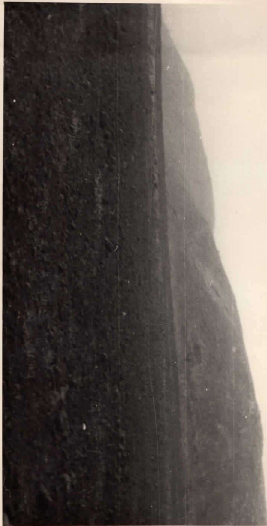
Славянское городище X-XI вв./северо-восточная часть вала/. Винницкая обл., Ильинецкий р-н, с.Пархомовка.