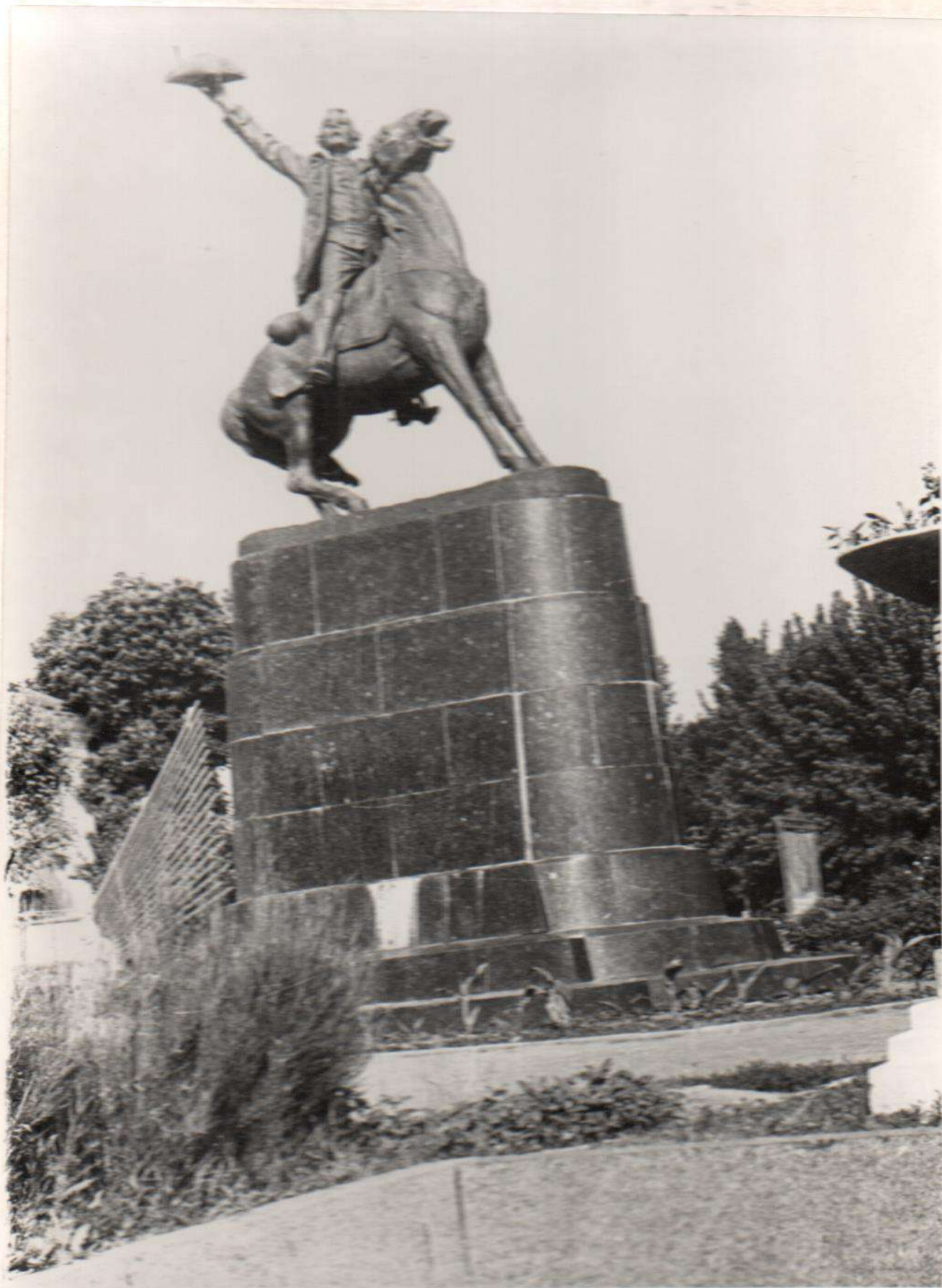
Пам'ятник О.В.Суворову Відкритий в 1954 р. Вінницька область, Тульчинський район, м.Тульчин Фото Слободяник В.С., 1974 р.