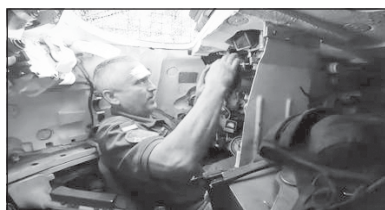
На сторінці бригади «Червона Калина» розповіли історію танкіста з позивним Урі. 59-річний чоловік все життя працював на залізницях. Ще під час строкової служби багато років тому здобув спеціальність навідника і тепер знову став танкістом.

«Я все життя на залізницях працював. Я оглядач-ремонтник був. Син пішов, зять пішов, ну я і вирішив іти на війну», — розповідає він.