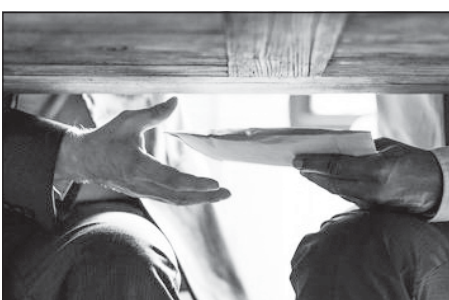
Кількість винесених вироків за корупцію

Від початку повномасштабної війни до осені 2023 року декларації посадовців не перевірялись. Дані за 2021 та за 2022 роки чиновники мали подати до початку 2023 року, а за минулий рік — до квітня 2024.