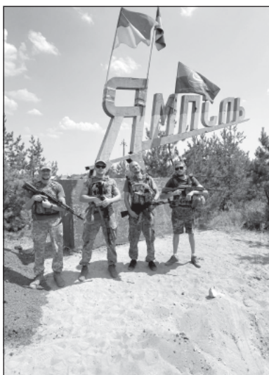
У свої 21 — уже командир бойового підрозділу, обороняв Бахмут та брав участь у боях на Куп'янському напрямку

— ПРИКОРДОННИК З ВІННИЧЧИНИ ІЗ ПОЗИВНИМ СТУДЕНТ